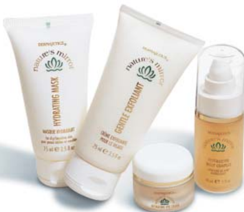
Bilden är ett exempel – produkterna varierar från land till land

Day Defense är en fuktcreme som kombinerar ett system för kontinuerlig fukttilförsel med vitaminer som bekämpar fria radikaler för att få klarare, slätare, sundare hy. #0303